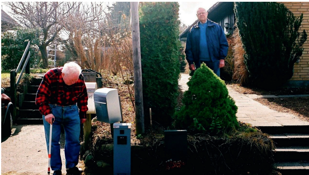
Stillbillede fra Hjemmefronten .